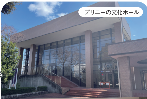
プリニーの文化ホール