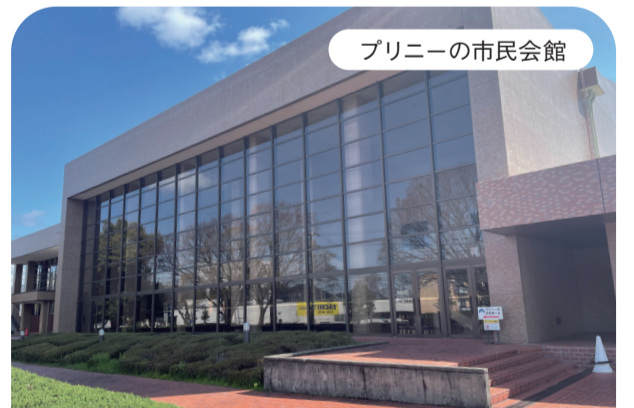
プリニーの市民会館