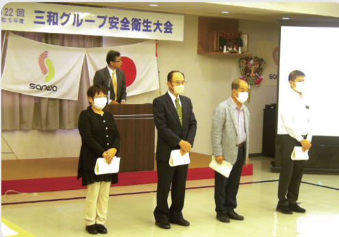
安全衛生標語 受賞者のみなさん

開催日時: 令和6年10月26日(土) 9:30~11:30 開催場所: 本社4階多目的ホール