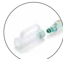
アタッチメントが付属します。