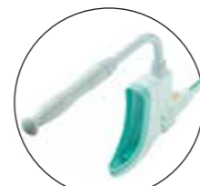
ハンドルが付属します。