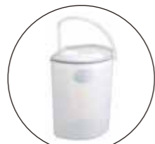
尿タンク・ブラシ入れが付属します。