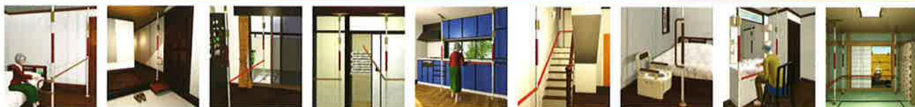
ベッドからの立ち上がり ～歩行サポート