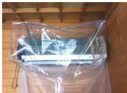
専用シートでカバー