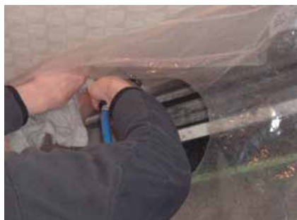
専用洗剤液で高圧洗浄