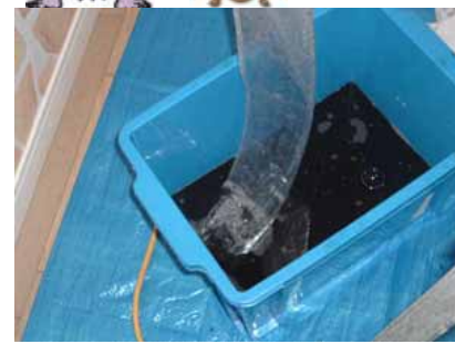
内部はこんなに汚れています