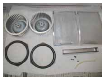
こんなに綺麗になります

レンジフードをお掃除しますと換気能力がアップしお部屋も汚れません。気持ちよく調理ができます。