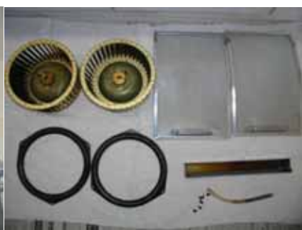
レンジフードの内部はこんなに汚れています。